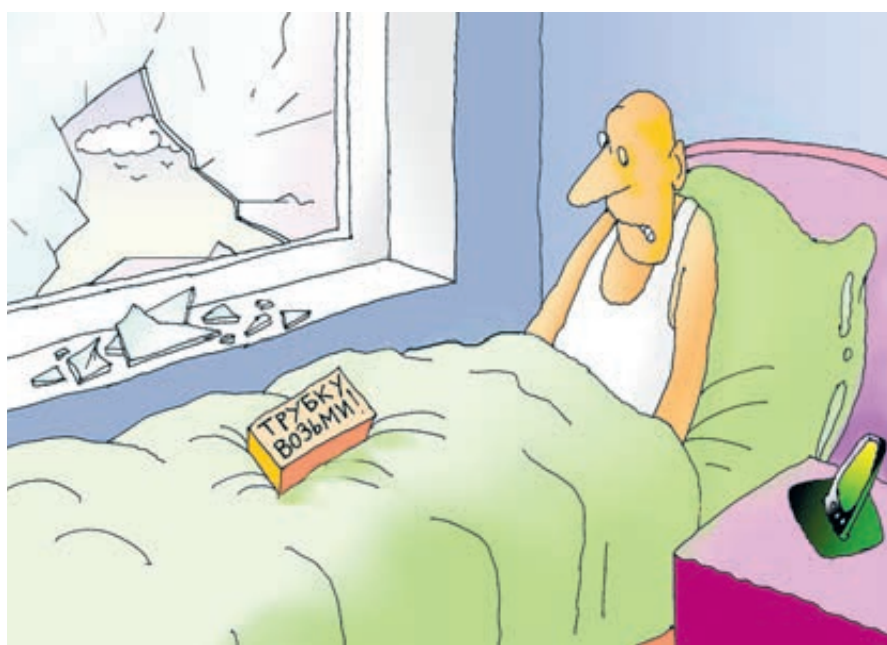
ИЛЛЮСТРАЦИЯ НИКОЛАЯ НИЖИЧАРОВА/САЙТ ПУШКИН.РУ

«Да оплатил я! Только что оплатил!» – сделал я строгое замечание своему услужливому телефону. Телефон обиделся и заткнулся. Но ненадолго. Через пару часов банк эсмэску продублировал. И всю следующую неделю телефон мстительно и отвратительно квакал по несколько раз в день – с настойчивостью, достойной лучшего применения.