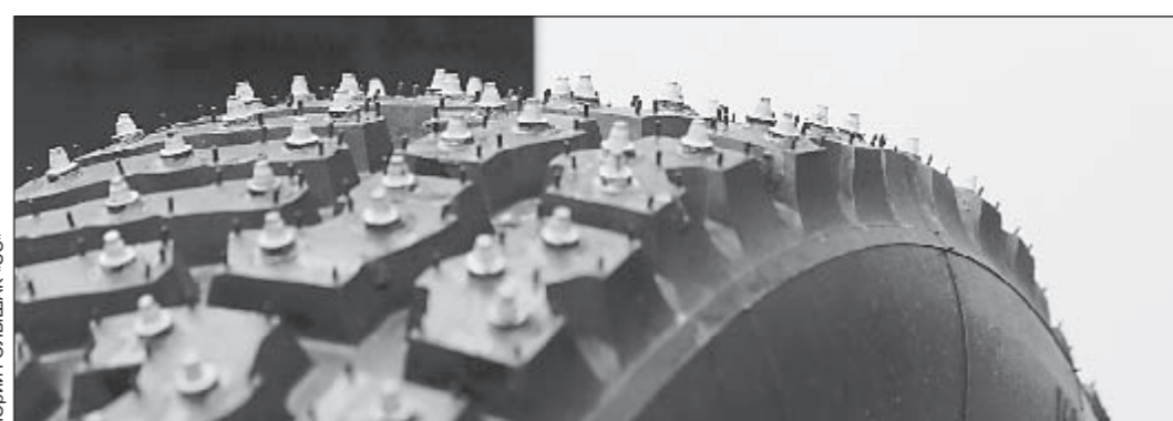
Такие «страшные» шины Michelin выпускает специально для гонок на льду.

Я понятия не имел, куда еду. Даже о Лебе не знал ничего. Это теперь знаю все. Включая много лишнего.