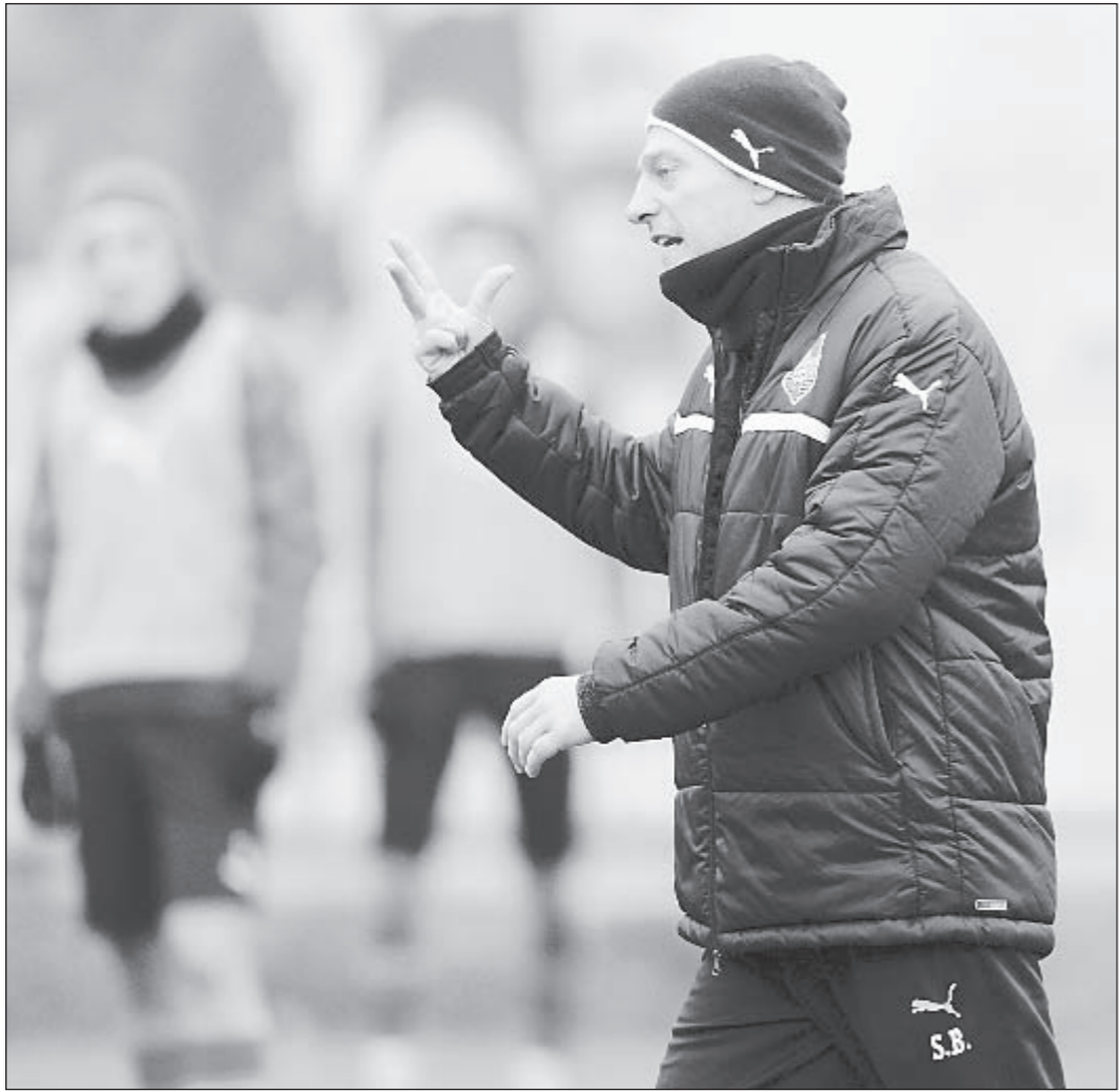
Вчера. Баковка. Славен БИЛИЧ.

Серия из шести матчей без побед не повергла главного тренера «Локомотива» в депрессию. Он по-прежнему уверен, что его команда справится с ситуацией.