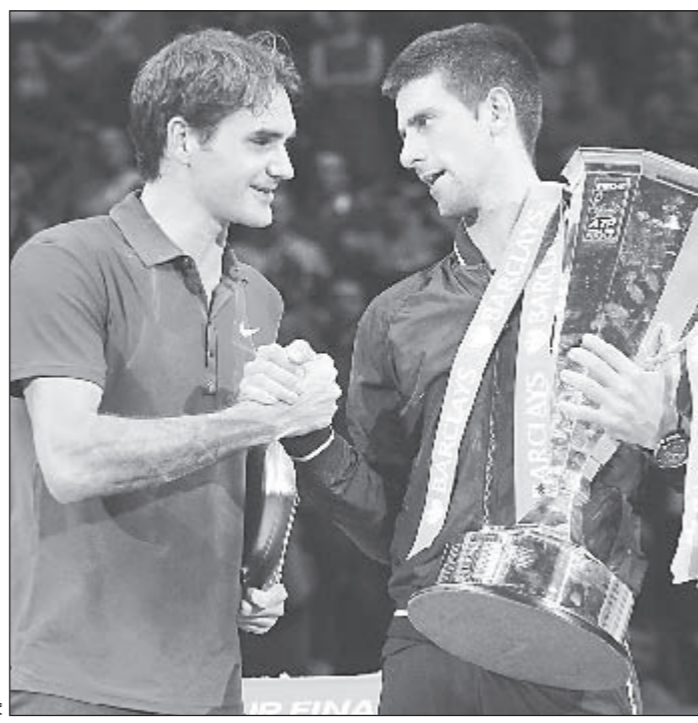
12 ноября. Лондон. Победитель итоговых турниров Новак ДЖОКОВИЧ (справа) и его соперник по финалу Роджер ФЕДЕРАЕР выиграли в нынешнем сезоне по 6 титулов.

Отменно провел заключительный отрезок сезона, став первым за 10 лет теннисистом, который сумел дважды подряд обыграть Федерера