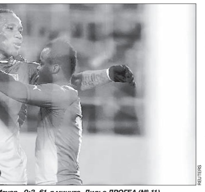
Среды. Линц. Австрия - Кот-д'Ивуар - 0:3. 61-я минута. Дидье ДРОГБА (№ 11) празднует свой гол с Ласина ТРАОРЕ и Максом ГРАДЕЛЬ.

Саудовская Аравия - Аргентина - 0:0. Аргентина: Ромеро, Сабалета, Колочини, Фернандес, Рохо, Маскерано, Коста (Фернандес, 46), Сальво (Ди Санто, 46), Ди Мария, Месси, Агуэро. Чили - Сербия - 1:3 (Энрикес, 87 - Л.Маркович, 23, Джорджевич, 48, Джу-