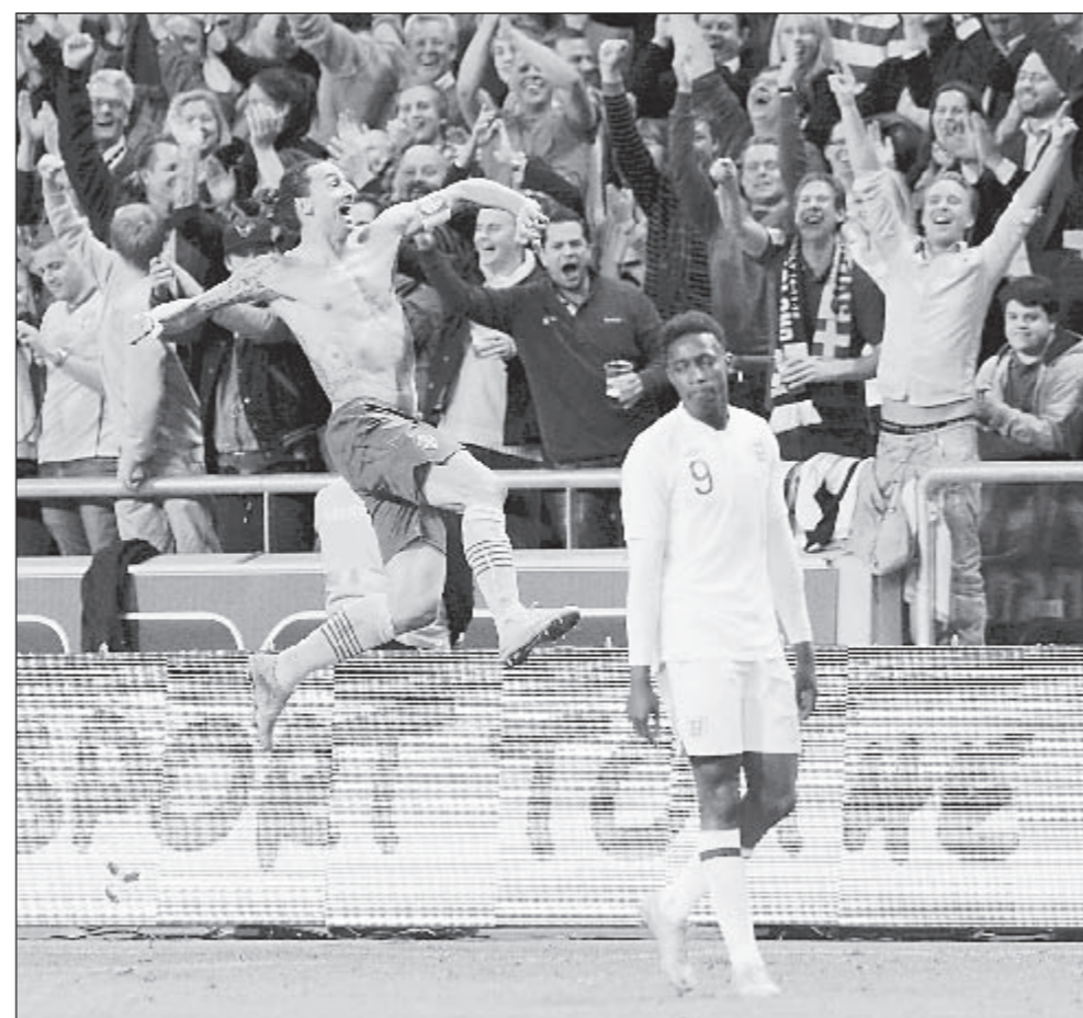
Среда. Стокгольм. Швеция - Англия - 4:2. 90+1-я минута. Только что Златан ИБРАГИМОВИЧ забил чудо-гол.

Швеция - Англия - 4:2 (Ибрагимович, 20, 78, 84, 90+1 - Уэлбек, 35, Колкер, 38). Швеция: Исааксон, Лустиг (Сана, 74), Гранквист (Антонссон, 73), М. Ульссон, Ю. Ульссон (Сэфари, 46), Чельстрем (А. Свенссон, 61), Эльм, С. Ларссон (Янссон, 86), Ксандрикл, Ибрагимович, Рангел (Вернблум, 89). Англия: Харт, Джонсон (Дженкинсон, 75), Колкер (Шоуррос, 74), Кэйхилл, Байнс, Джерард (Хаддлстоун, 75), Клеверли (Уильямс, 61), Осман, Янг (Старридж, 61), Стерлинг (Баб, 85), Уэлбек.