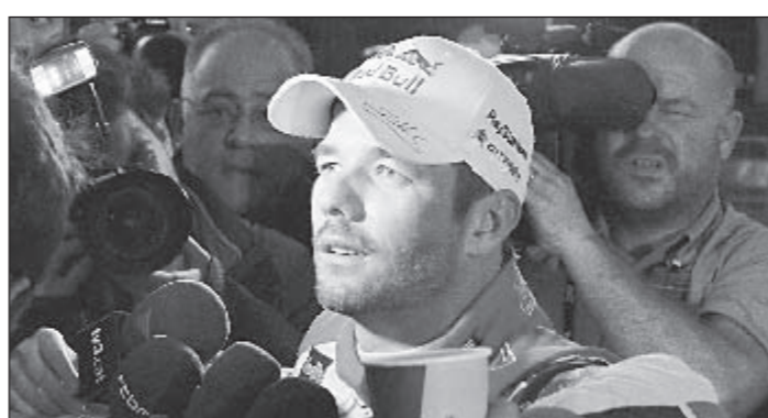
Великий и ужасный Себастьян ЛЕБ.