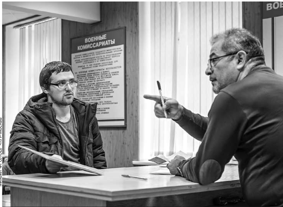
Документы, подтверждающие право на отсрочку по состоянию здоровья, нужно сразу предоставить в военкомат.

- После полугода кропотливой работы семьи кузнецов Гуриных из Слободского автомобиль был полностью отреставрирован и сегодня занял свое законное место на прогулочной части улицы Спасской, - доложил Симаков.