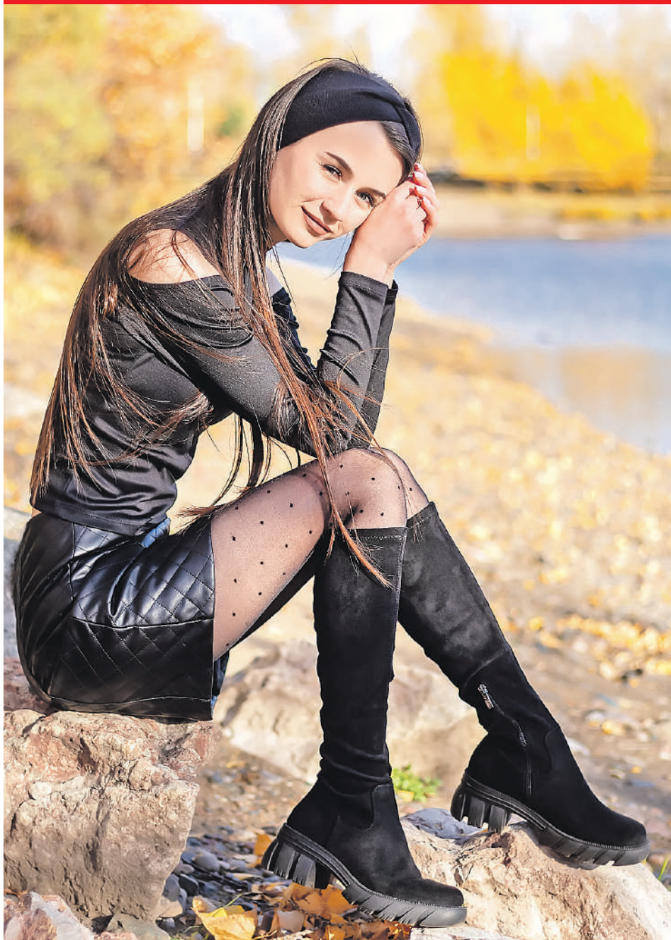
Дизайн ИВАНОВА «КП» - Красноярск