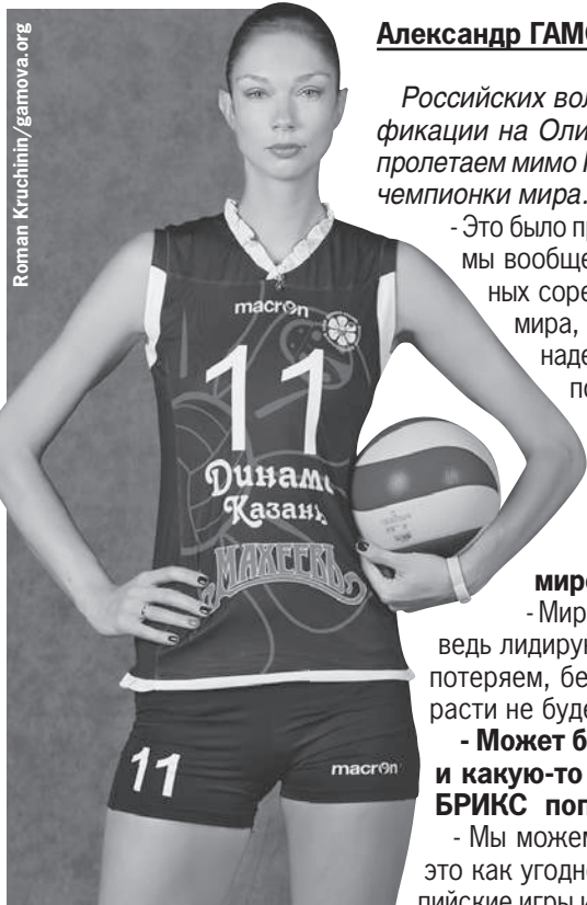
Катя Гамова советует не паниковать раньше времени.