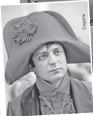
Владимир Зеленский (на фото слева) так вжился в роль Наполеона, что и на посту президента готов на все ради сохранения власти. А вышиванка и бомба - уже равноценные национальные символы Украины.

западные «кураторы» ошиваются. И работы над «грязным» проектом могут быть на завершающей стадии.