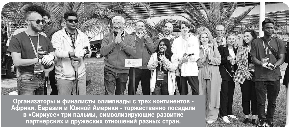
Организаторы и финалисты олимпиады с трех континентов - Африки, Евразии и Южной Америки - торжественно посадили в «Сириусе» три пальмы, символизирующие развитие партнерских и дружеских отношений разных стран.

Я уверена, что финалисты этой олимпиады будут приезжать в «Сириус» уже как руководители стартапов или крупных проектов, а также в качестве педагогов или экспертов. Включение школьников в обсуждение сложных вопросов - защиты банковской сферы, финансовой грамотности и других - это уже важный профессиональный шаг в подготовке специалистов.