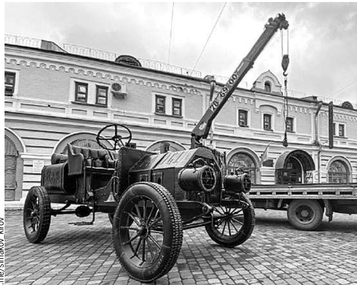
Арт-объект вернулся на свое место в начале недели.