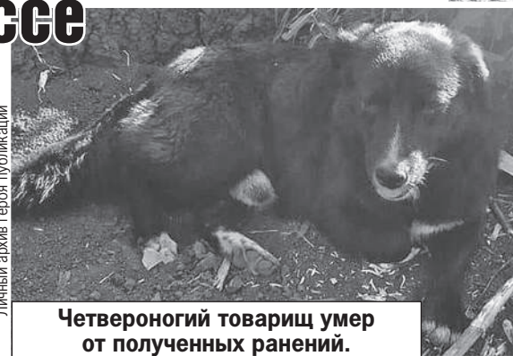
Четвероногий товарищ умер от полученных ранений.